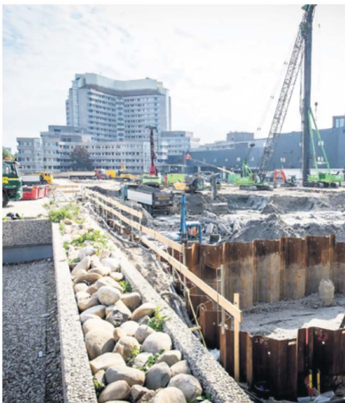
Nieuwbouw van de Europese Octrooi Organisatie. Op de achtergrond het huidige kantoor van EPO, dat wordt afgebroken na voltooiing van het nieuwe kantoor.

Battistelli zegt dat de campagne ten doel had hervormingen te blokkeren die hij bij zijn aantreden in gang zette om de doelmatigheid en kwaliteit van de organisatie ‘naar het niveau van de 21ste eeuw te tillen’. En het tweede doel was volgens hem om het Europese eenheidsoctrooi te saboteren; dat vormt een bedreiging voor degenen die verdienen aan de huidige